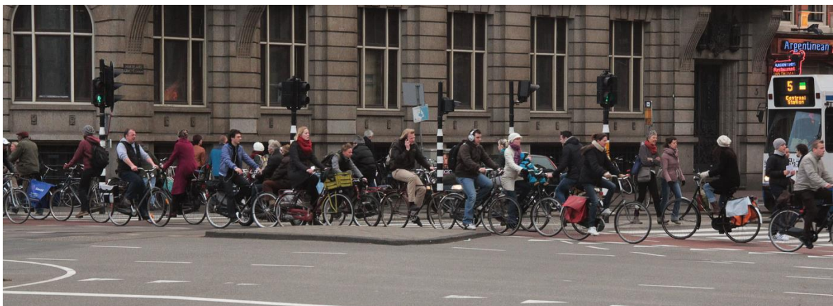
Kerékpáros közlekedés Amszterdamban