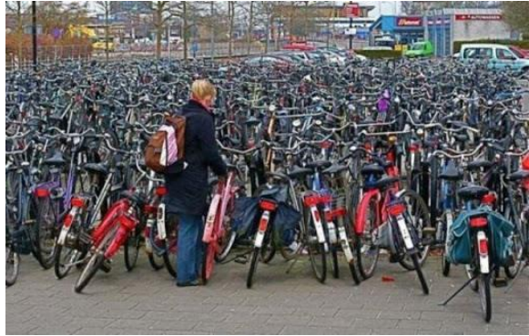
Budapest kerékpáros közlekedés_2020 nyár